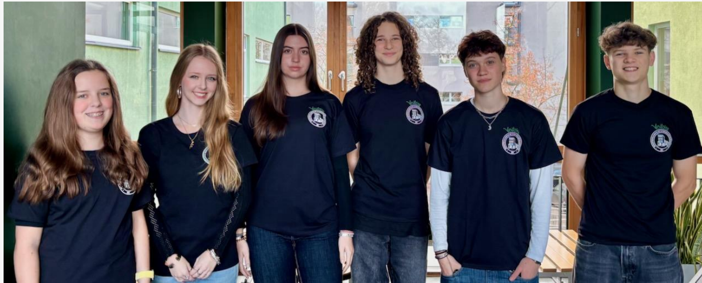
Die Schülervvertretung im Schuljahr 2025/2026 (am 18.11.2025)

Wir bleiben nicht da stehen, wo wir sind. Und das kann nur gelingen, wenn alle am Schulleben Beteiligten sich engagieren und konstruktiv miteinander kooperieren!