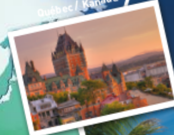
Québec / Kanada